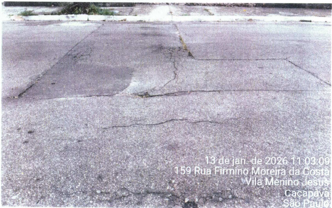
Foto 8: Local com afundamento, fissuração e deslocamento do reparo

Rua Regente Feijó, 18, Vila Santos, Caçapava – SP Tel. (12) 3652-5909 | secretaria.obras@cacapava.sp.gov.br