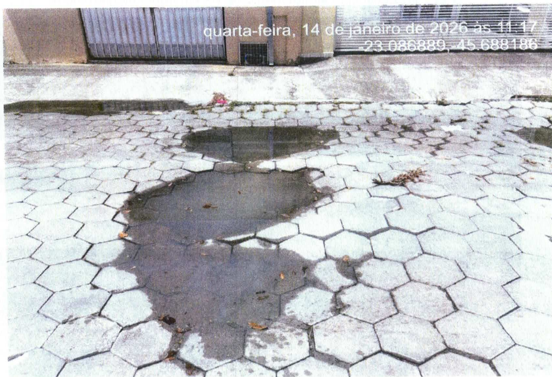
Foto 16: Local com afundamento na via em frente ao hidrômetro Rua Regente Feijó, 18, Vila Santos, Caçapava – SP Tel. (12) 3652-5909 | secretaria.obras@cacapava.sp.gov.br