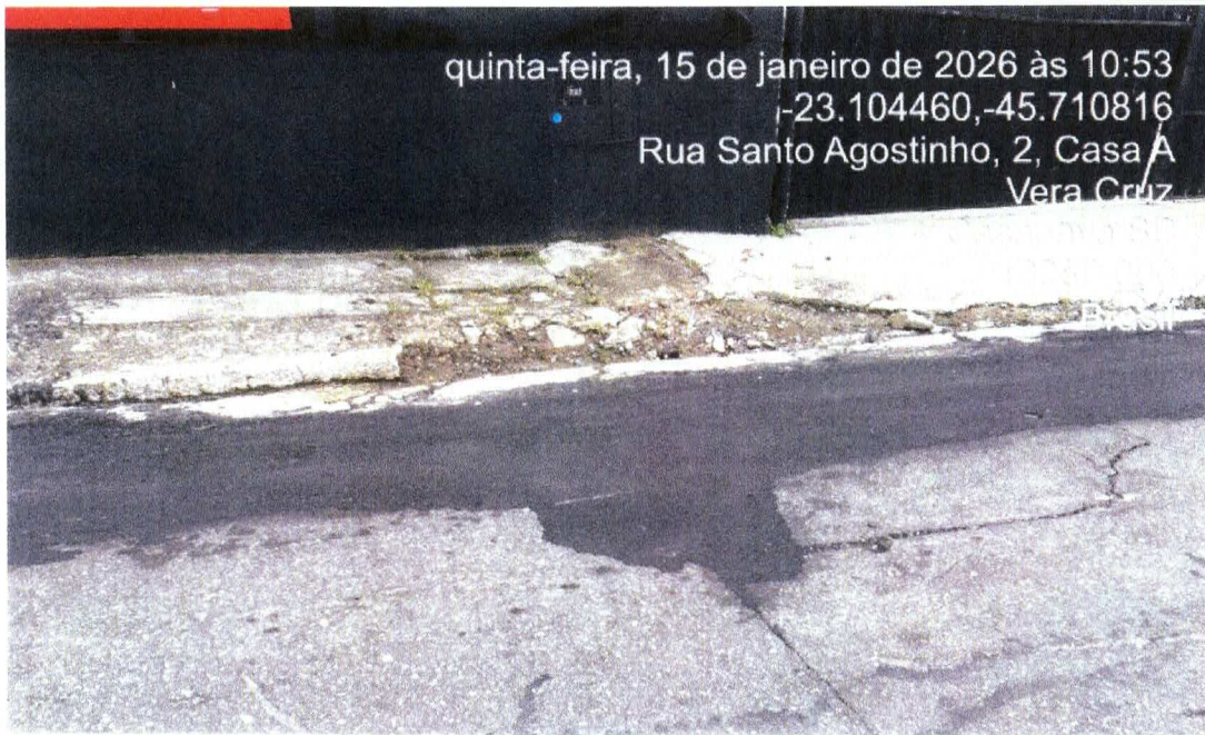
Foto 31: Reparo realizado sem alinhamento, ondulações no pavimento e desagregação