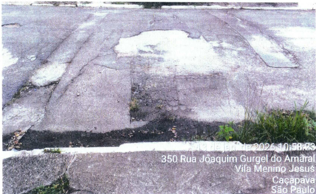
Foto 6: Local com afundamento, deslocamento e fissuração do reparo realizado

Rua Regente Feijó, 18, Vila Santos, Caçapava – SP Tel. (12) 3652-5909 | secretaria.obras@cacapava.sp.gov.br