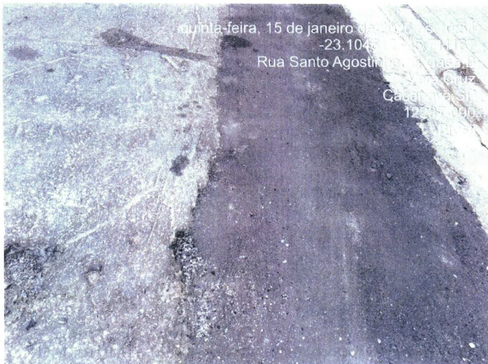
Foto 26: Reparo realizado sem alinhamento, ondulações no pavimento e desagregação

Rua Regente Feijó, 18, Vila Santos, Caçapava – SP Tel. (12) 3652-5909 | secretaria.obras@cacapava.sp.gov.br