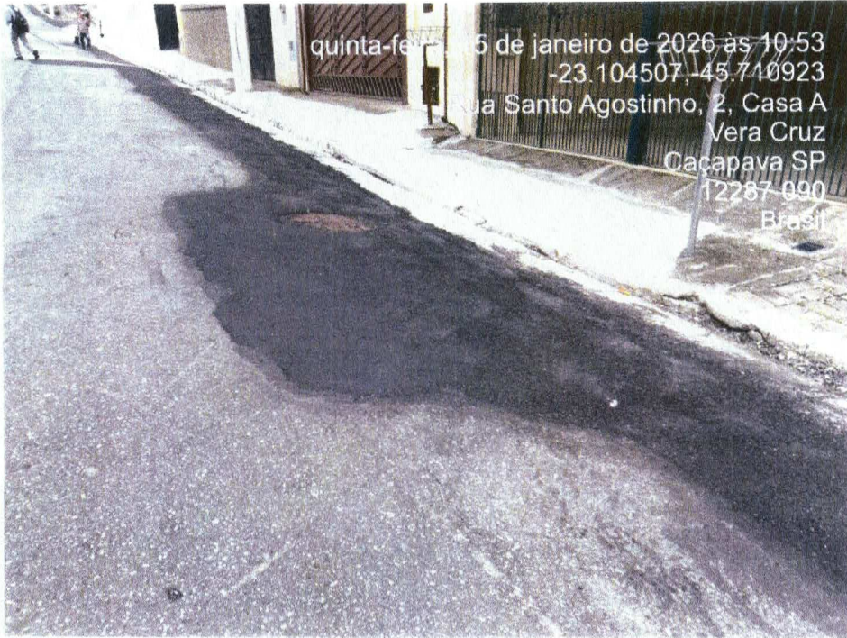
Foto 27: Reparo realizado sem alinhamento, ondulações no pavimento e desagregação