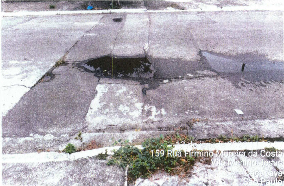
Foto 7: Local com afundamento, empoçamento, e degrau aparente na via